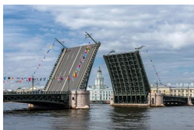
Санкт - Петербург